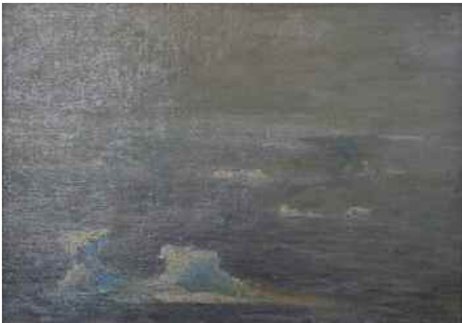
Aage Bertelsen: Den første is. 30. juli 1906. 22 cm x 32 cm.