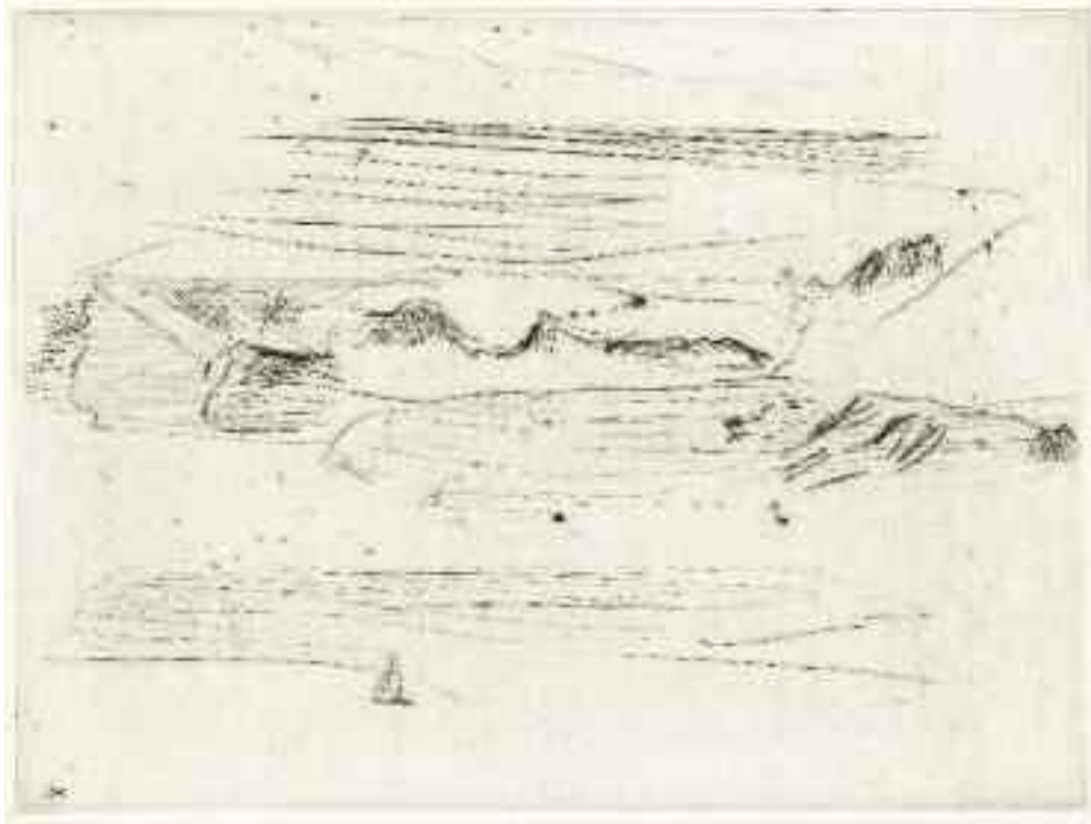
Untitled, 2009 [PKP-09-004e]