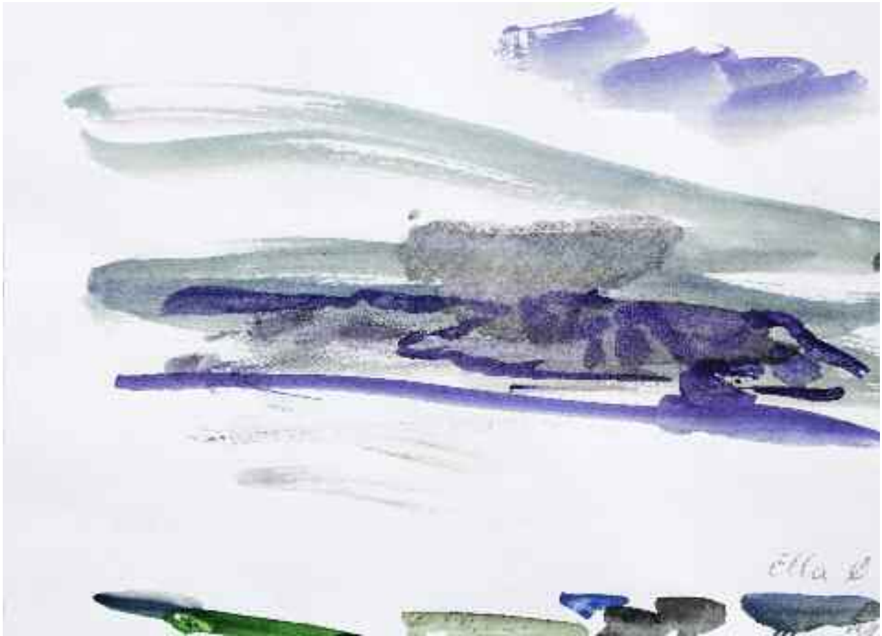
Untitled (Ella Ø), 2009 [PKG-09-032]