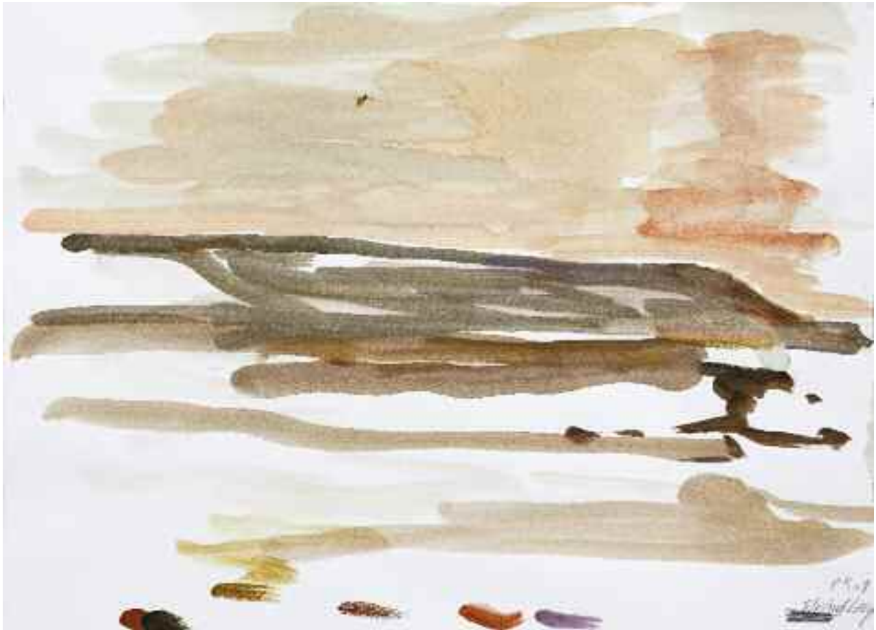
Untitled (Strindberg), 2009 [PKG-09-030]