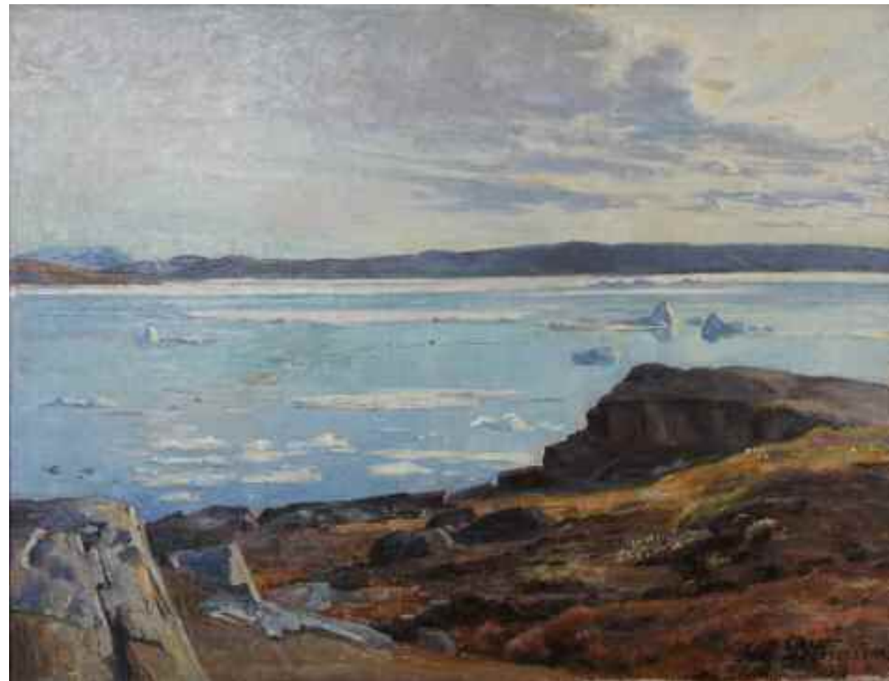
Aage Bertelsen: Udsigt til Koldewey-øerne. September 1906. 60 cm x 78 cm.