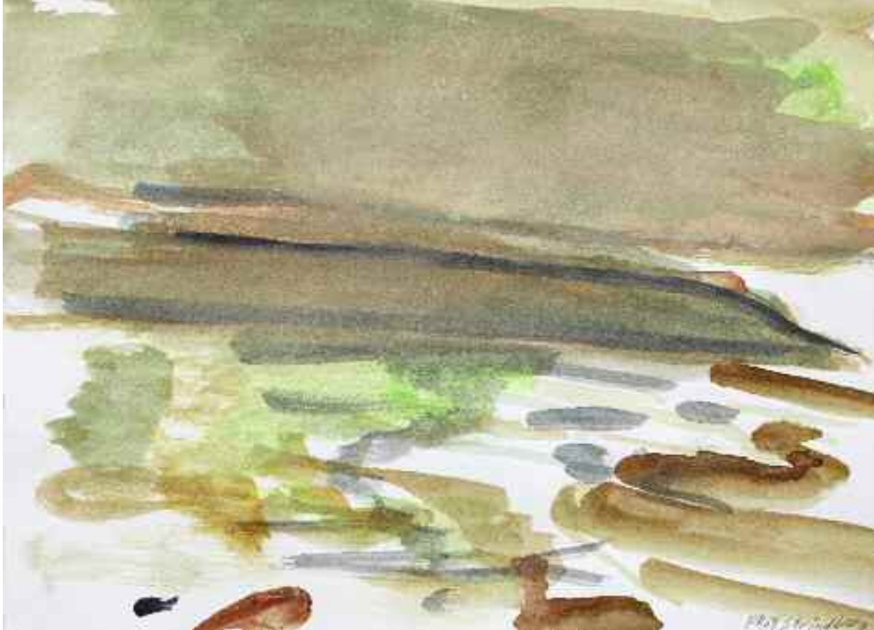
Untitled (Strindberg), 2009 [PKG-09-029]