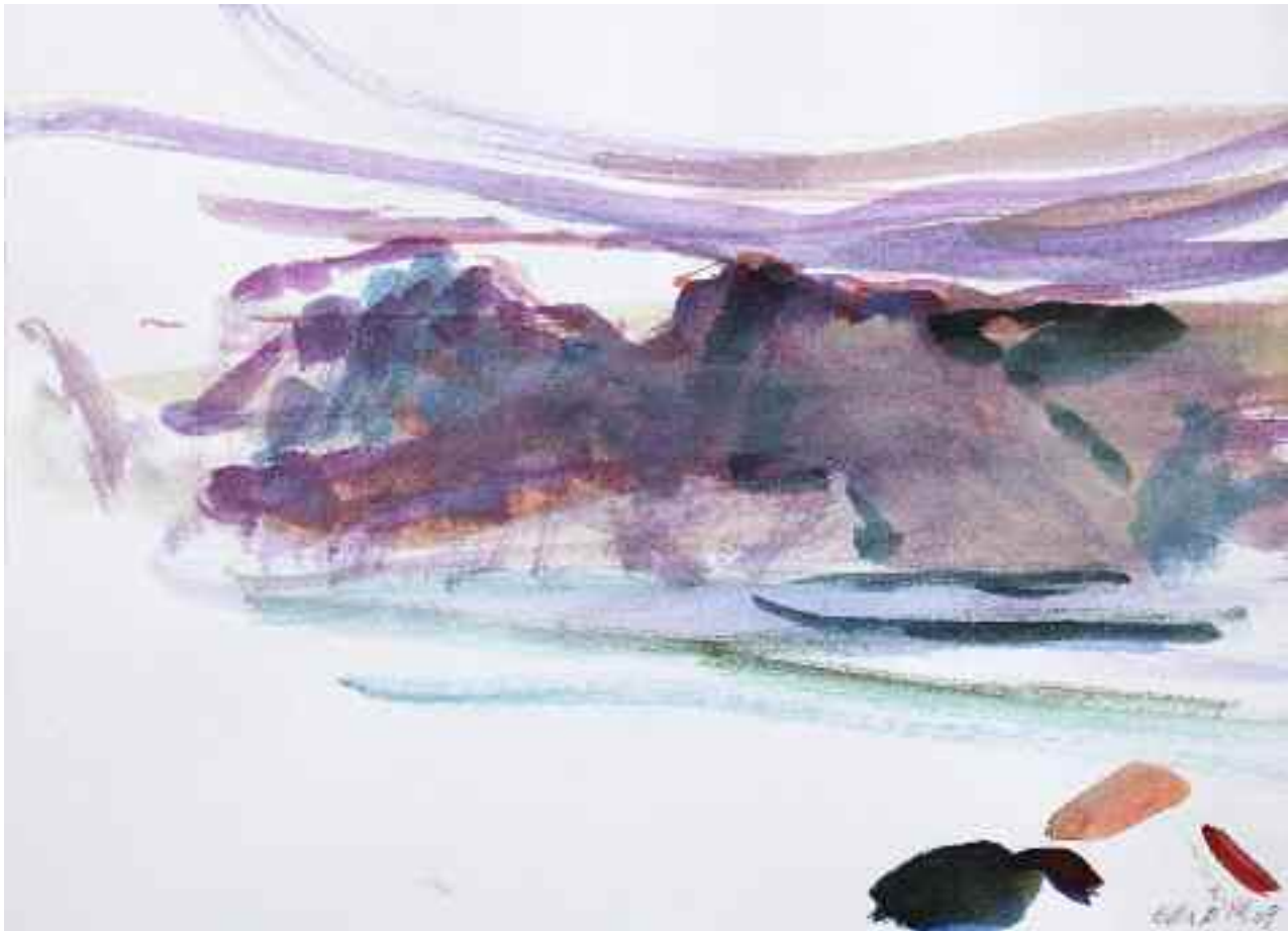
Untitled (Ella Ø), 2009 [PKG-09-036]