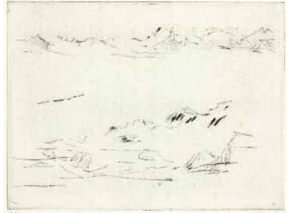
Untitled, 2009 [PKP-09-004j]