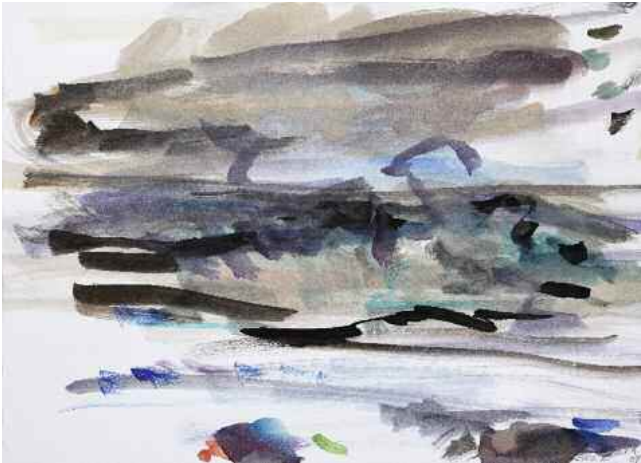
Untitled (Ella Ø), 2009 [PKG-09-038]