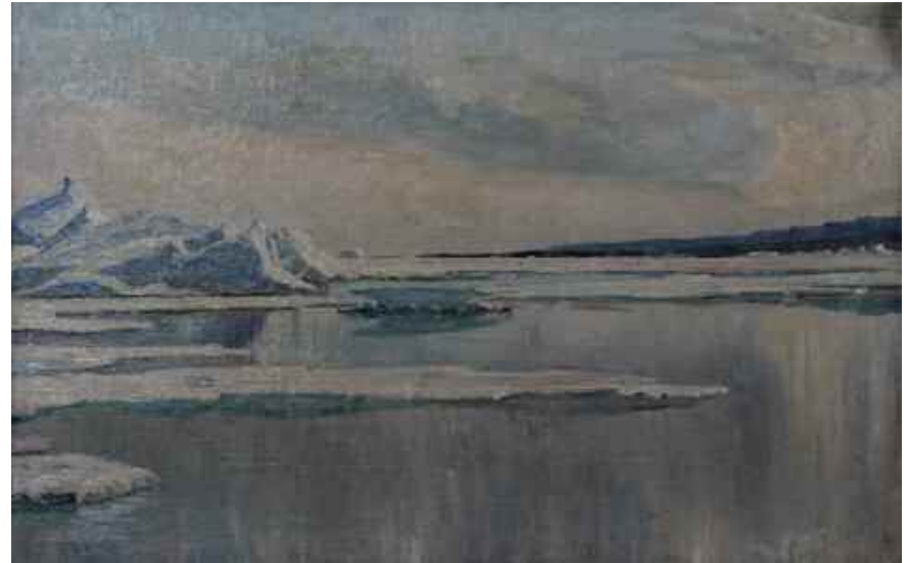
Johannes Achton Friis: Stille solskinsdag i isen i Danmarkshavn, Juli 1907. 37 cm x 57 cm.