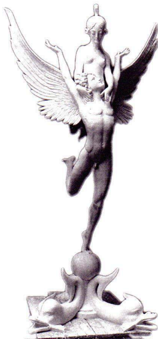
Eros flyver med Psyke (1920-1921), gips h.288, b. 165, d. 123 cm