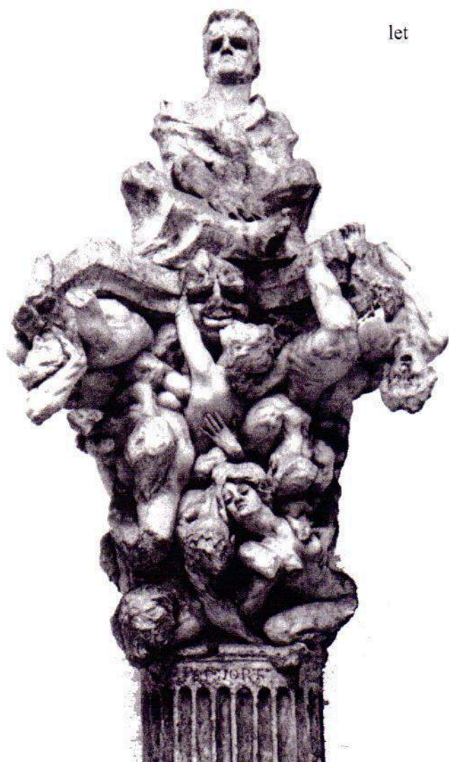
Frigjort (1900-1901), gips, h.592, b.219, d. 180 cm.

Hvilke ord synes du passer til billede nr. 1 Og hvilke til billede nr. 2