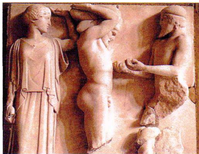
Relief på Zeustemplet i Olympia ved Akropolis i Athen. Gudinden Athene står bag Herakles som bærer himmelhvælvet og foran ham står Atlas med hesperidernes æbler i hænderne. Rudolph Tegner har været på Akropolis flere gange i sit liv.

Herakles bragte æblerne til Kong Eurystes og alle blev forundrede. Eurystes havde ikke regnet med at Herakles ville lykkes med det og blev bange for at guderne ville straffe ham for at have æblerne som gav udødelighed – en udødelighed som han ikke havde fortjent. Kongen valgte derfor at give Herakles æblerne tilbage. Helten Herakles brød sig dog ikke om æblerne og ofrede dem til gudinden Athene, som tidligere havde hjulpet ham. Han lagde æblerne på hendes alter og næste dag hang de igen på Livets Træ i Hesperidernes Have, hvor de hænger endnu.