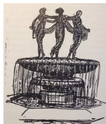
Edvard Eriksens brønd