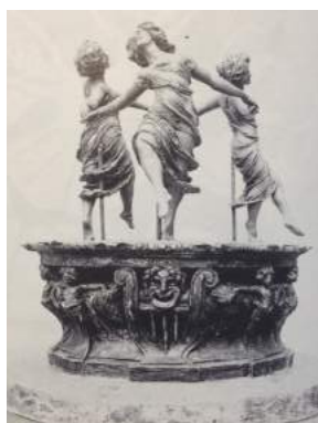
Rudolph Tegers brønd