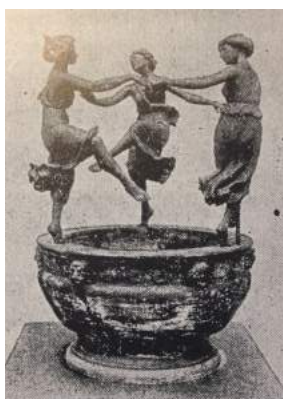
Carl Bonnesens brønd

De tre kunsternes forslag til brønden forestiller det samme men var alligevel forskellige på mange måder. Prøv at snakke om, hvordan brøndene er forskellige.